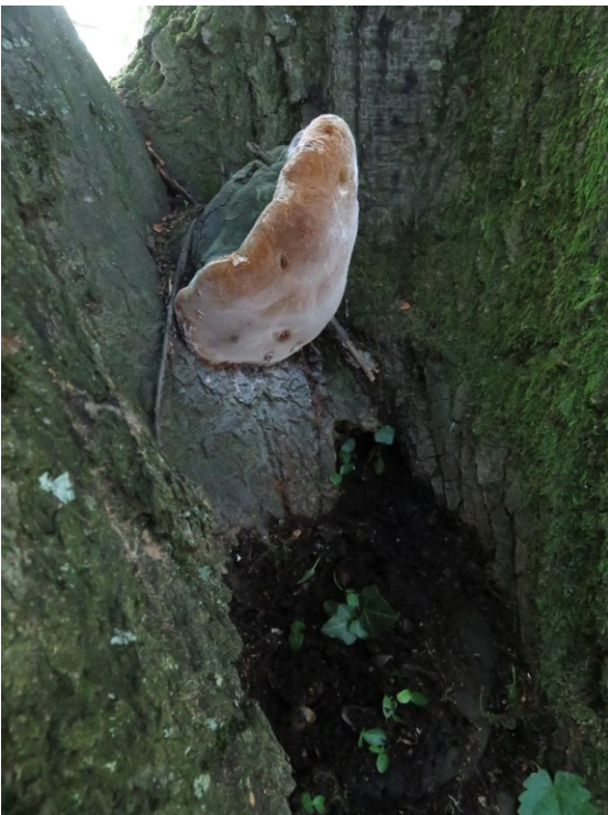
Eichen-Feuerschwamm in Vergabelung