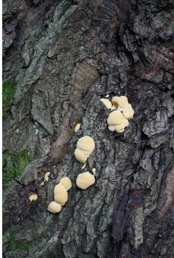
Rot-Eiche im Süden von Leipzig mit einem Stammumfang von 5,7 m. Fruchtkörper vom Schwefelporling im Jugendstadium (Foto rechts).